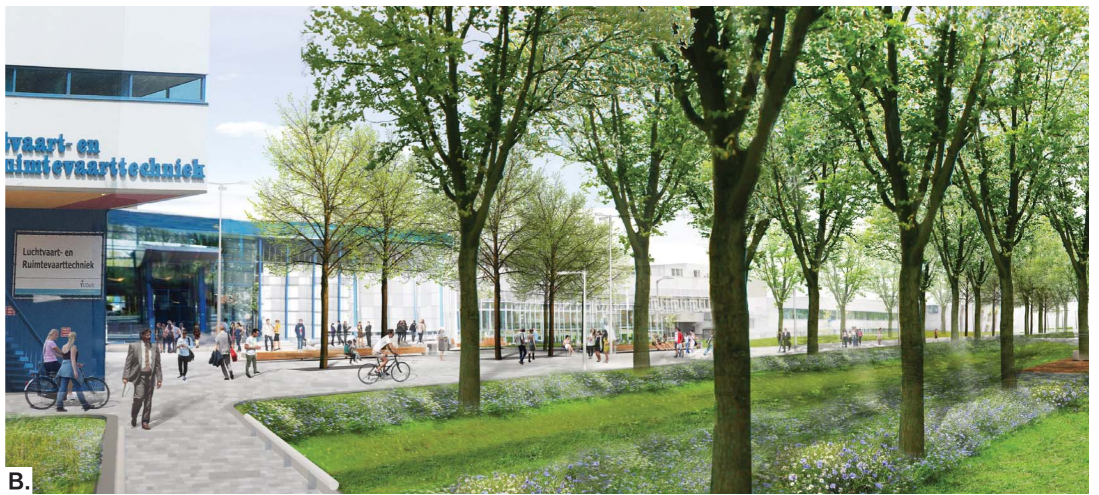
B. Impressie entreezone L&R gebouw