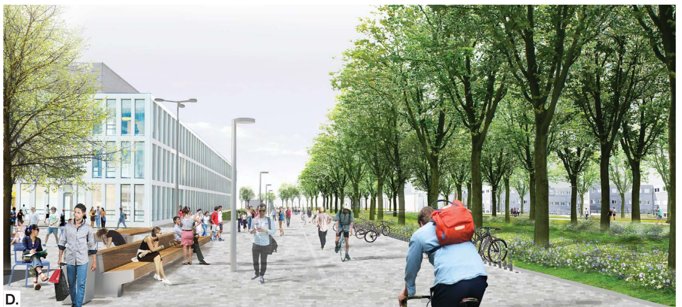
D. Impressie entree TNW gebouw aan Kluyverpark