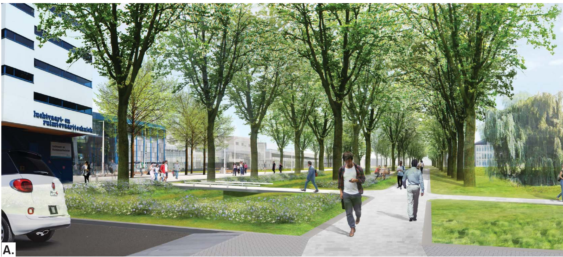
A. Impressie entree Kluyverpark vanaf Rotterdamweg