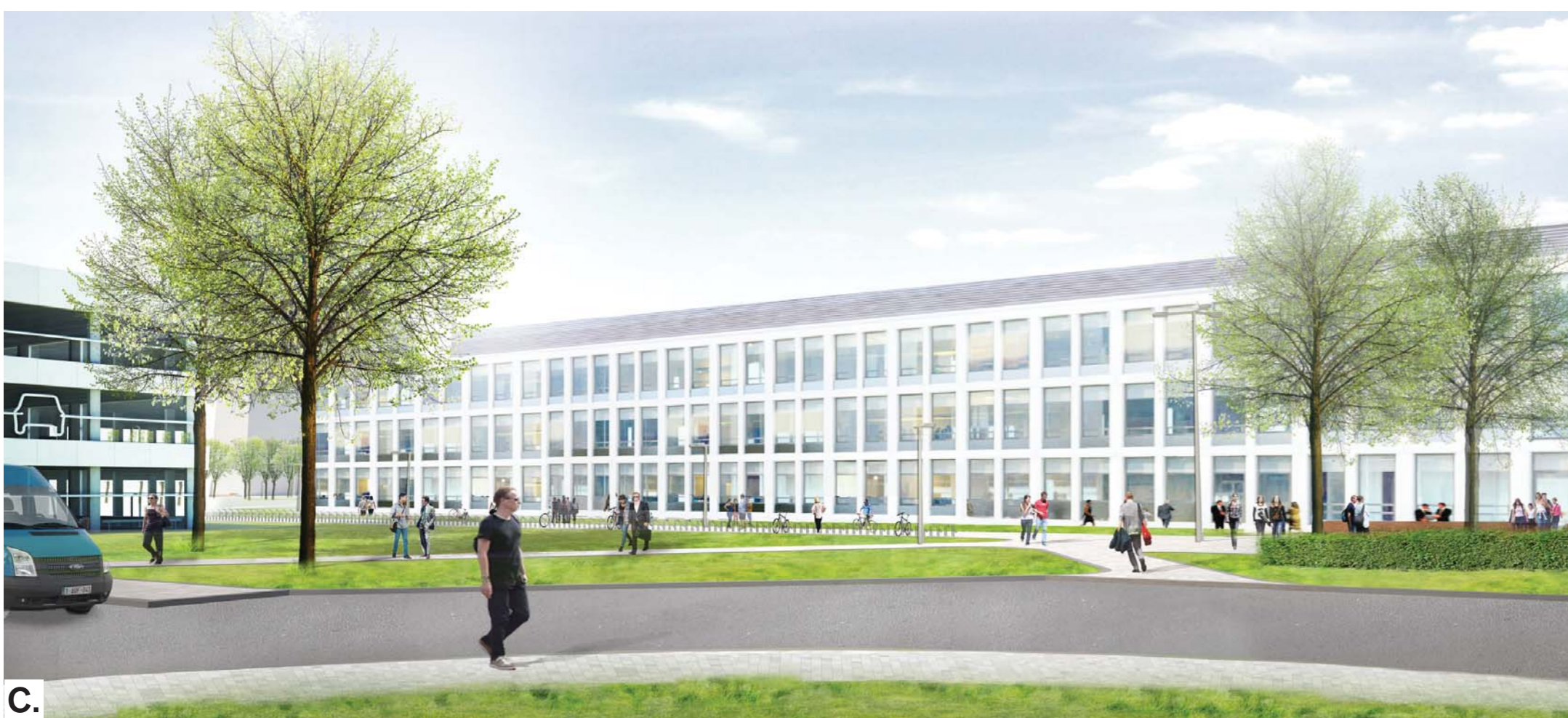
C. Impressie entree TNW gebouw en parkeergebouw